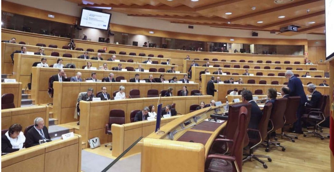
Imagen del pleno del Senado.

Los socialistas desoyen el llamamiento de Pedro Sánchez a apoyar la iniciativa